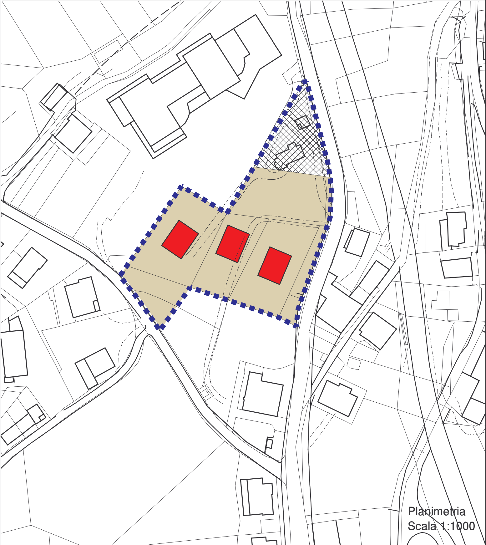
Planimetria Scala 1:1000