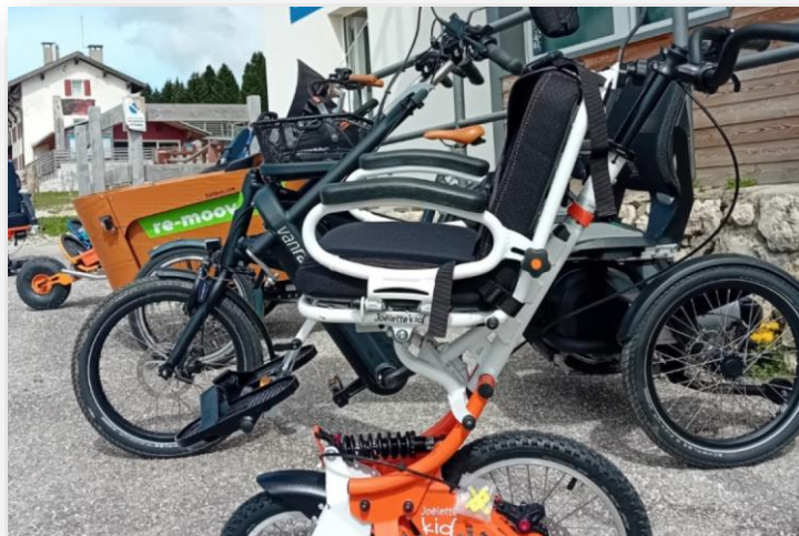
Acquisto di n. 6 e-bike 4 all