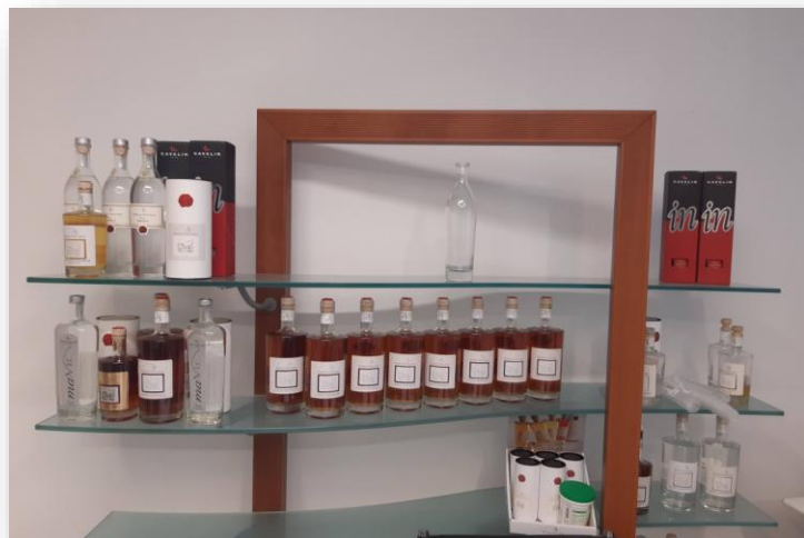
Miglioramento della produzione di distillati