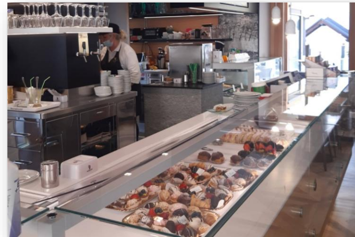
Ampliamento locali pasticceria