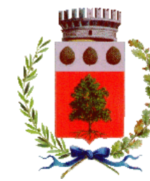
COMUNE DI BEDOLLO