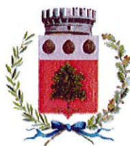
COMUNE DI BEDOLLO