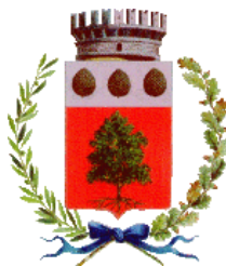
COMUNE DI BEDOLLO